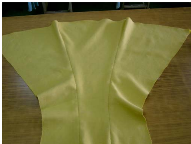
รูปที่ 6.16 การเย็บตะเข็บตัวกระโปรงชั้นหน้า