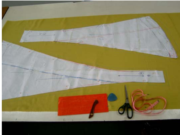
รูปที่ 6.5 การวางแบบตัดกระโปรงชุดราตรีลงบนผ้า