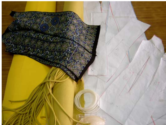
รูปที่ 6.1 วัสดุในการวางแบบตัดชุดราตรียาว

แบบตัดหลัง ผ้าตัดชุดราตรี (ผ้าฝ้าย) ผ้ารองใน (ผ้าต่วนแข็ง) และผ้าซับใน