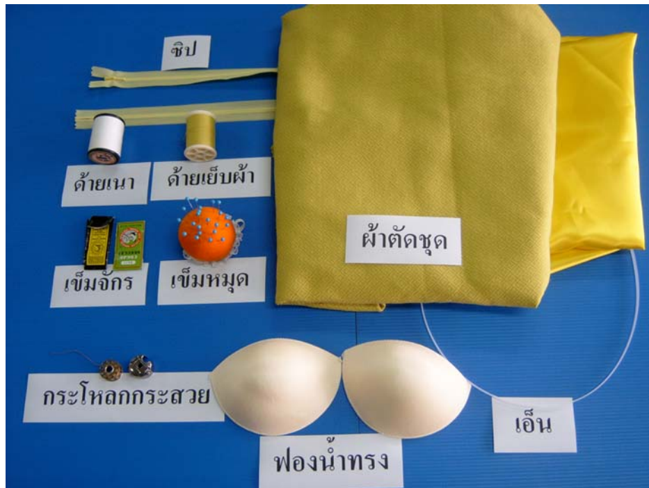
รูปที่ 6.8 วัสดุและเครื่องจักรสำหรับเย็บชุดราตรียาว