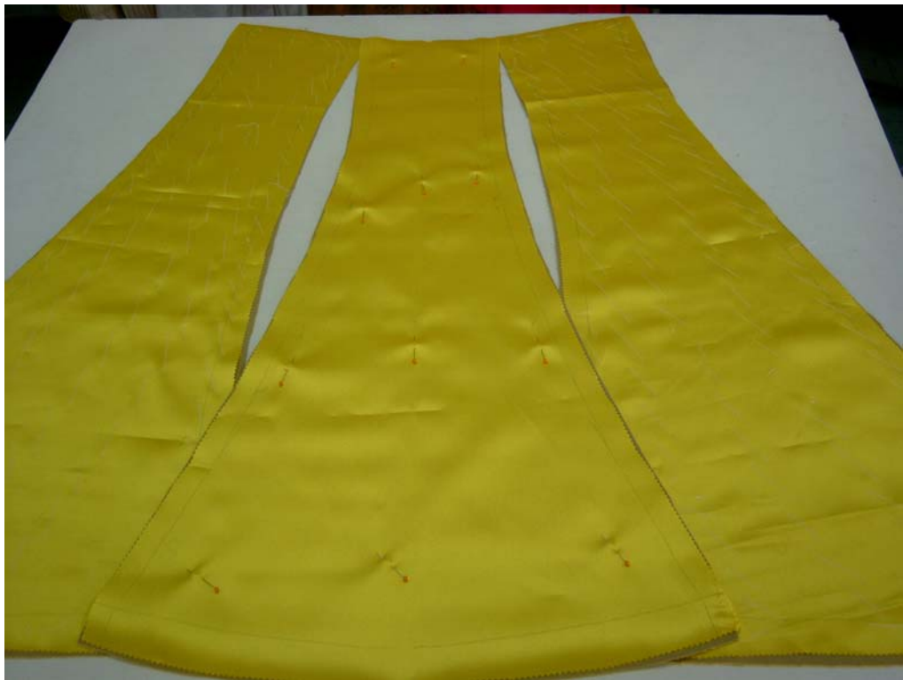
รูปที่ 6.10 การเย็บกันลุ่ยแนวตะเข็บข้าง กระโปรงขึ้นหน้า