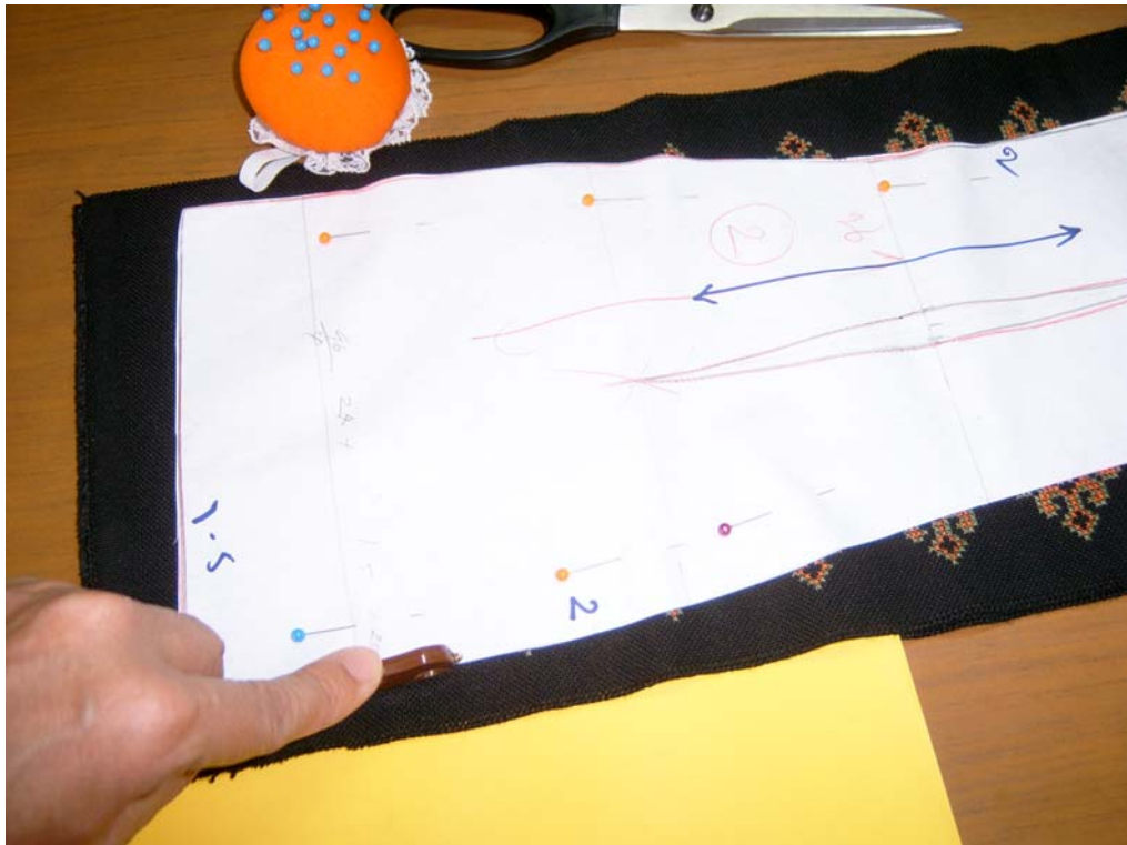
รูปที่ 6.7 การทำเครื่องหมายสำหรับเย็บลงบนผ้าตัดชุดราตรียาว