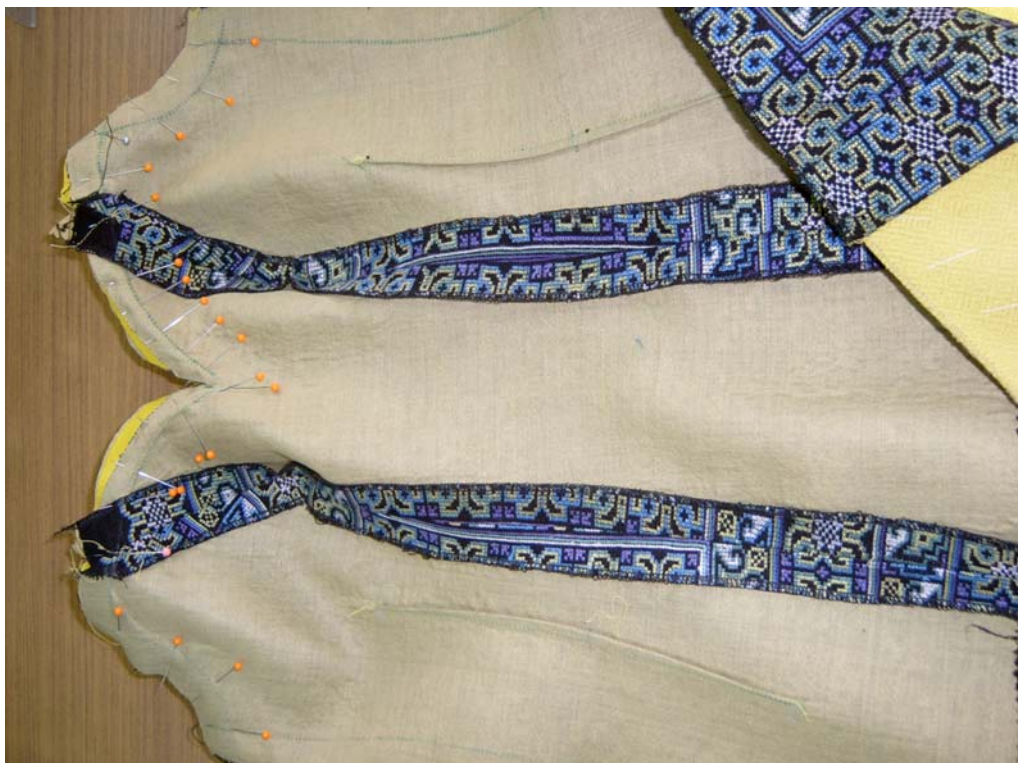
รูปที่ 6.18 การเย็บประกอบตัวเสื้อกับซับใน กลับสาปตัวเสื้อ