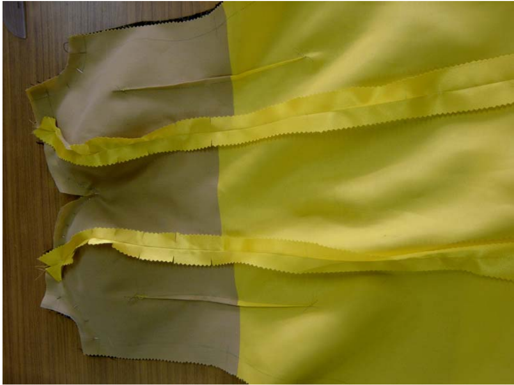
รูปที่ 6.17 การเย็บประกอบซับใน