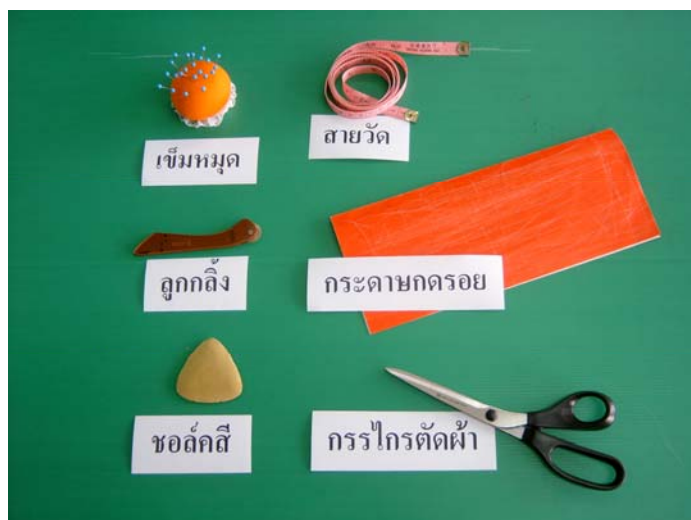
รูปที่ 6.2 เครื่องมือที่ใช้ในการวางแบบตัดชุดราตรียาว

ลูกกลิ้ง ซอส์คีสี่ และกรรไกรตัดผ้า ขนาด 7-9 นิ้ว