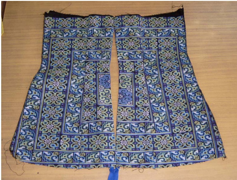
รูปที่ 6.12 และรูปที่ 6.13 การเย็บซิปซ่อน ตัวเสื้อของแผ่นหลัง