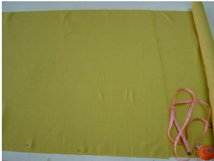
รูปที่ 6.3 การวางผ้าบนโต๊ะให้เรียบเพื่อวางแบบตัดชุดราตรี

ขั้นที่ 1 จับริมผ้าทั้ง 2 ข้างของหน้าผ้านี้ด้านผิวด้านกัน วางผ้าทั้งผืนบนโต๊ะ โดยใช้ไม้บรรทัดยาวปาดผืนผ้าที่ย่นไปทางด้านริมผ้าให้ผ้าเรียบ