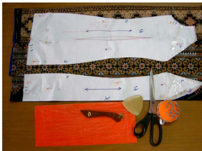
รูปที่ 6.4 การวางแบบตัดเสื้อชุดราตรีลงบนผ้า

ขั้นที่ 2 วางแบบตัดชุดราตรียาว ควรวางแบบตัดทุกชิ้นพร้อม ๆ กันก่อน วางแบบตัดเสื้อแผ่นหน้า เสื้อแผ่นหลัง วางแบบตัดกระโปรงแผ่นหน้า-แผ่นหลัง และชิ้นส่วนประกอบอื่น ๆ ถ้าผ้าไม่พอจะได้แก้ปัญหาได้ทันทั่วทั้งที่ กัดเข็มหมุดโดยรอบบนแบบตัดทุกชิ้น เพื่อเย็บบนผ้าตัดชุด ใช้ชอล์กสี ทำเครื่องหมายเพื่อเย็บโดยรอบ