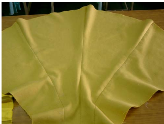
รูปที่ 6.15 การเย็บตะเข็บตัวกระโปรงชั้นหลัง