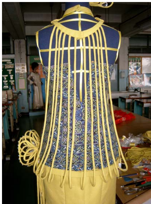
รูปที่ 6.19 การเย็บใส่ไว้ตกแต่งตัวเสื้อด้านหลัง