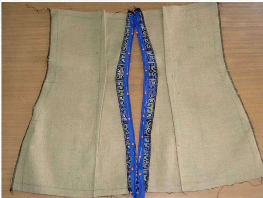
รูปที่ 6.11 การเย็บตะเข็บกลางหลัง 2 ชั้นเพื่อตัดซิปซ่อน

ขั้นที่ 3 การเนาขึ้นหลัง 2 ชั้นให้ติดกัน เย็บตะเข็บกลางหลัง โดยเว้นแนวซิปซ่อน 16 นิ้ว รีดเบาะตะเข็บกลางหลัง ตัดซิปซ่อน