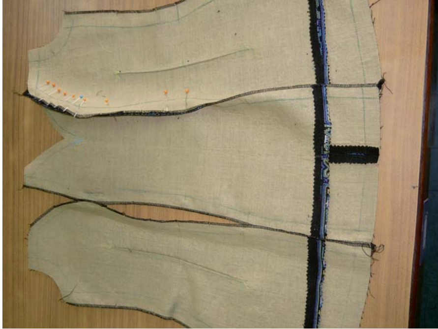
รูปที่ 6.11 การเย็บเกลือเย็บตัวเสื้อขึ้นหน้าให้ลึมห้าหาเส้นกลางตัว

ขั้นที่ 2 การเนาเกลือเย็บเกลือขึ้นหน้า และขึ้นหลัง โดยเย็บเกลือเสื้อขึ้นหน้า ด้านบนถึงปลายเกลือ ให้ชิดแนวปลายเกลือ ปล่อยด้ายเหลือไว้สำหรับผูกปลายเกลือ รีดเกลือ ให้ลึมห้าหา เส้นกลางตัวด้านหน้า ส่วนเกลือขึ้นหลังรีดเกลือลึมห้าหาเส้นกลางตัวด้านหลัง