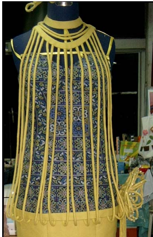
รูปที่ 6.19 การเย็บใส่ไว้ตกแต่งตัวเสื้อด้านหน้า

ขั้นที่ 7 ตกแต่งส่วนประกอบของตัวเสื้อ โดยการตัดผ้าเหลือง 45 องศา เย็บกลับใส่ไว้ ทำตัวเสื้อคลุมชุดราตรีทั้งด้านหน้าและด้านหลัง สอยชายกระโปรง