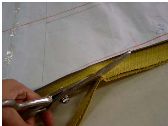
รูปที่ 6.6 การตัดผ้าตามแบบตัดชุดราตรี