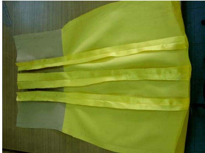
รูปที่ 6.14 การเย็บตะเข็บชั้นในตัวกระโปรงชั้นหลัง